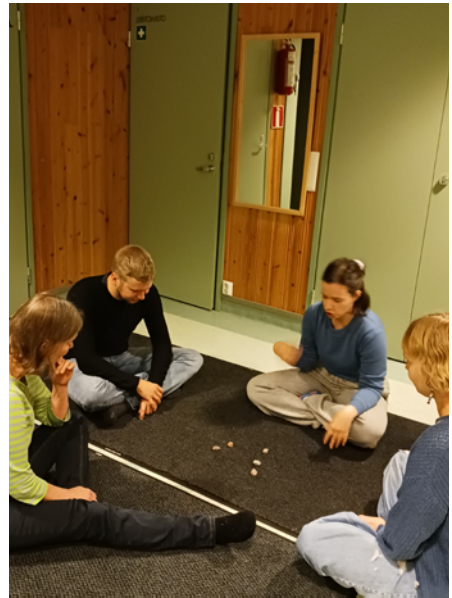
Vapaaehtoiset jakavat kokemuksia ja tunnistavat kansainvälisessä vapaaehtoistyössä hankittua osaamista palanneiden tapaamisessa.

Teeman tarkastelu saa Maailmanvaihdossa jatkoa marraskuussa, kun Studia-messuilla Helsingissä kuullaan Maailmanvaihdon vapaaehtoistyöohjelmien osallistujien paneelikeskustelu “Lost & Found – Uusia suuntia elämään kansainvälisestä vapaaehtoistyöstä”.